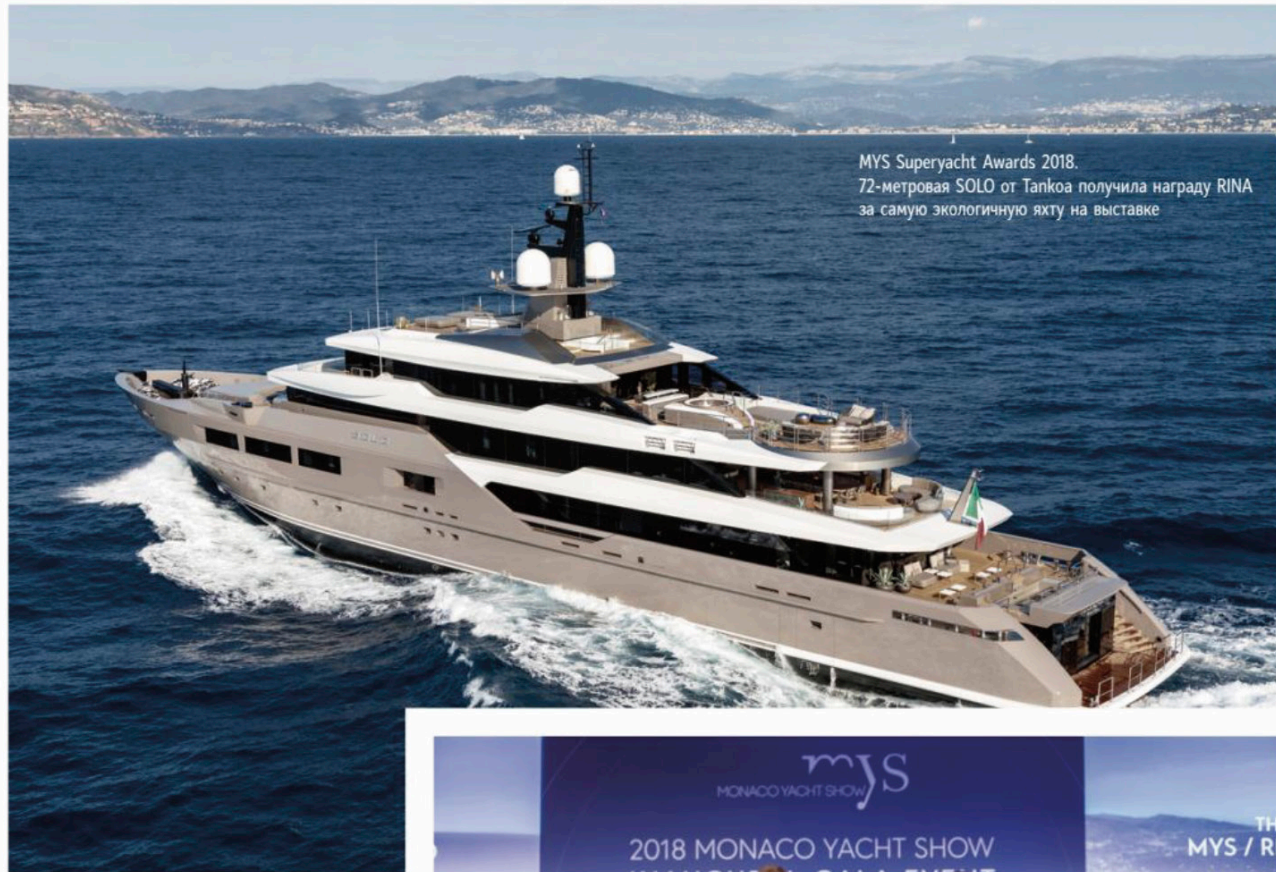
MYS Superyacht Awards 2018. 72-метровая SOLO от Tankoa получила награду RINA за самую экологичную яхту на выставке