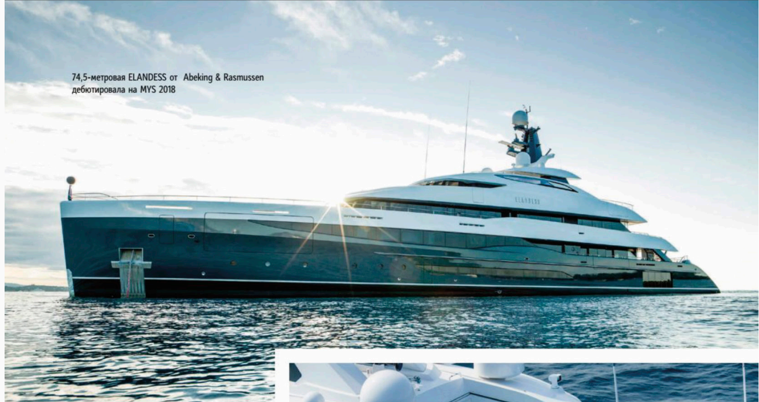
74,5-метровая ELANDESS от Abeking & Rasmussen дебютировала на MYS 2018

Oceanco, которая была спущена на воду в начале лета 2018 года. Отличный дизайн и технологические достижения яхты несут ДНК Oceanco и являются первыми в Нидерландах, которым будет дано официальное обозначение Lloyd's Register Integrated Bridge System (IBS). DAR имеет надстройку, полностью отделанную отражающим стеклом. Изнутри открывается панорамный вид от пола до потолка на корме, по левому и правому бортам. Дизайн был задуман так, чтобы у владельца были максимальные возможности для жизни на открытом воздухе и прямой контакт с морской средой.