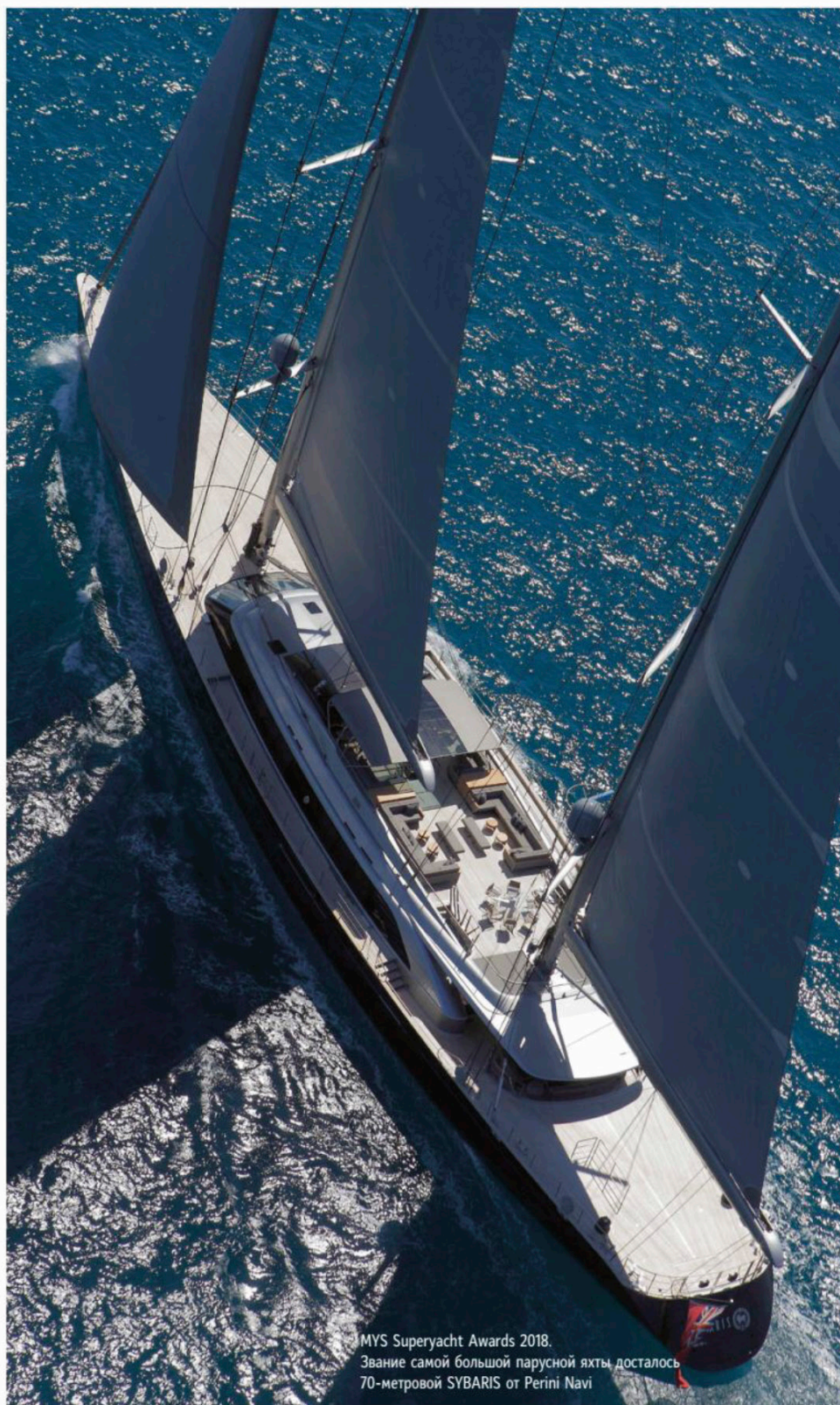
MYS Superyacht Awards 2018. Звание самой большой парусной яхты досталось 70-метровой SYBARIS от Perini Navi

DAR ОТ ГОЛЛАНДСКОЙ ВЕРФИ OCEANCO, КОТОРАЯ ВЫИГРАЛА ДВЕ ПРЕМИИ – «ЛУЧШИЙ ДИЗАЙН ЭКСТЕРЬЕРА» И «ЛУЧШАЯ НОВАЯ СУПЕРЬЯХТА»; ILLUSION PLUS, САМАЯ БОЛЬШАЯ ЯХТА ИЗ АЗИИ, ДЛИНОЙ 88,5 М И ПОСТРОЕННАЯ PRIDE MEGA YACHTS, ПОЛУЧИЛА НАГРАДУ «ЛУЧШИЙ ДИЗАЙН ИНТЕРЬЕРА»; А SOLO ОТ ИТАЛЬЯНСКОЙ ВЕРФИ TANKOA YACHTS ПОЛУЧИЛА НАГРАДУ RINA ЗА САМУЮ ЭКОЛОГИЧНУЮ ЯХТУ НА ВЫСТАВКЕ