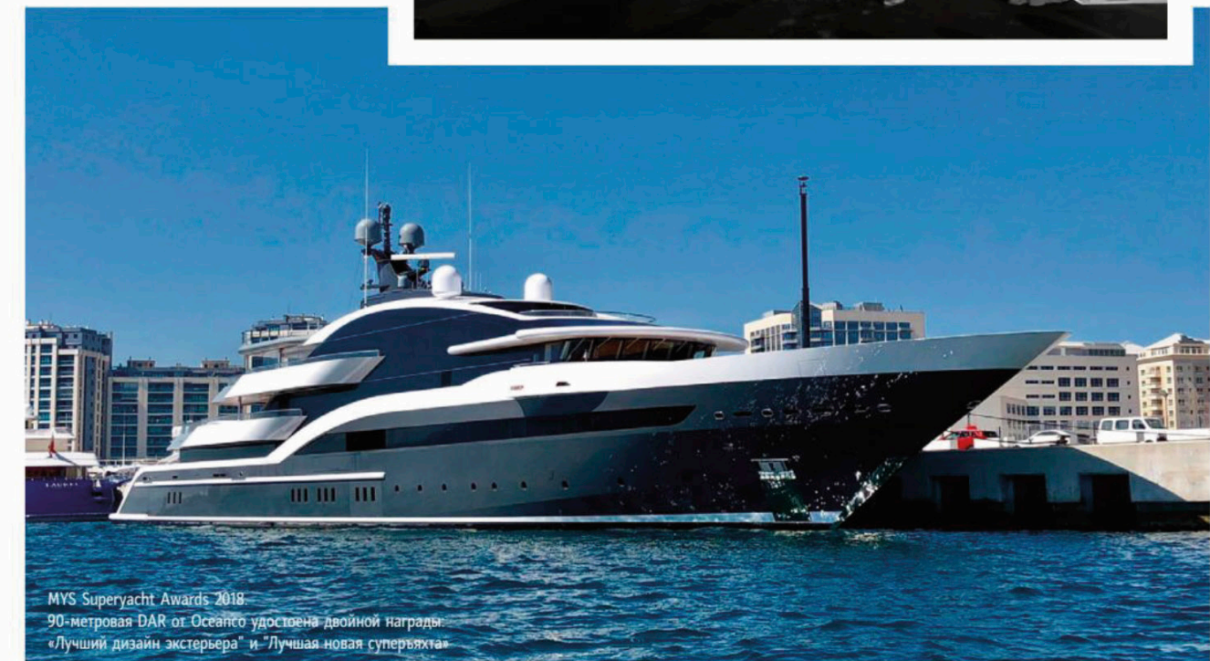
MYS Superyacht Awards 2018. 90-метровая DAR от Oseanco удостоена двойной награды: «Лучший дизайн экстерьера» и «Лучшая новая суперяхта»