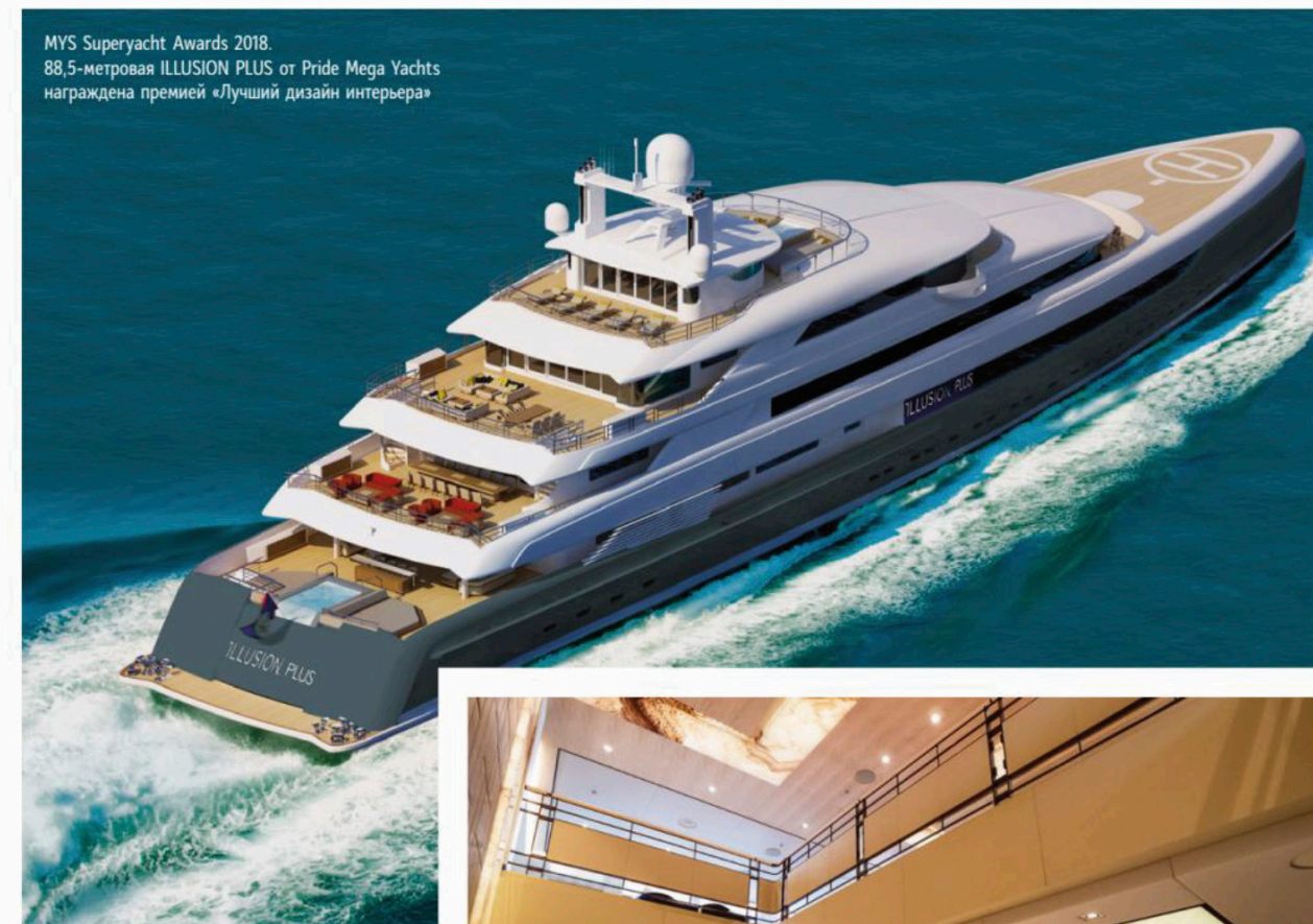
MYS Superyacht Awards 2018. 88,5-метровая ILLUSION PLUS от Pride Mega Yachts награждена премией «Лучший дизайн интерьера»