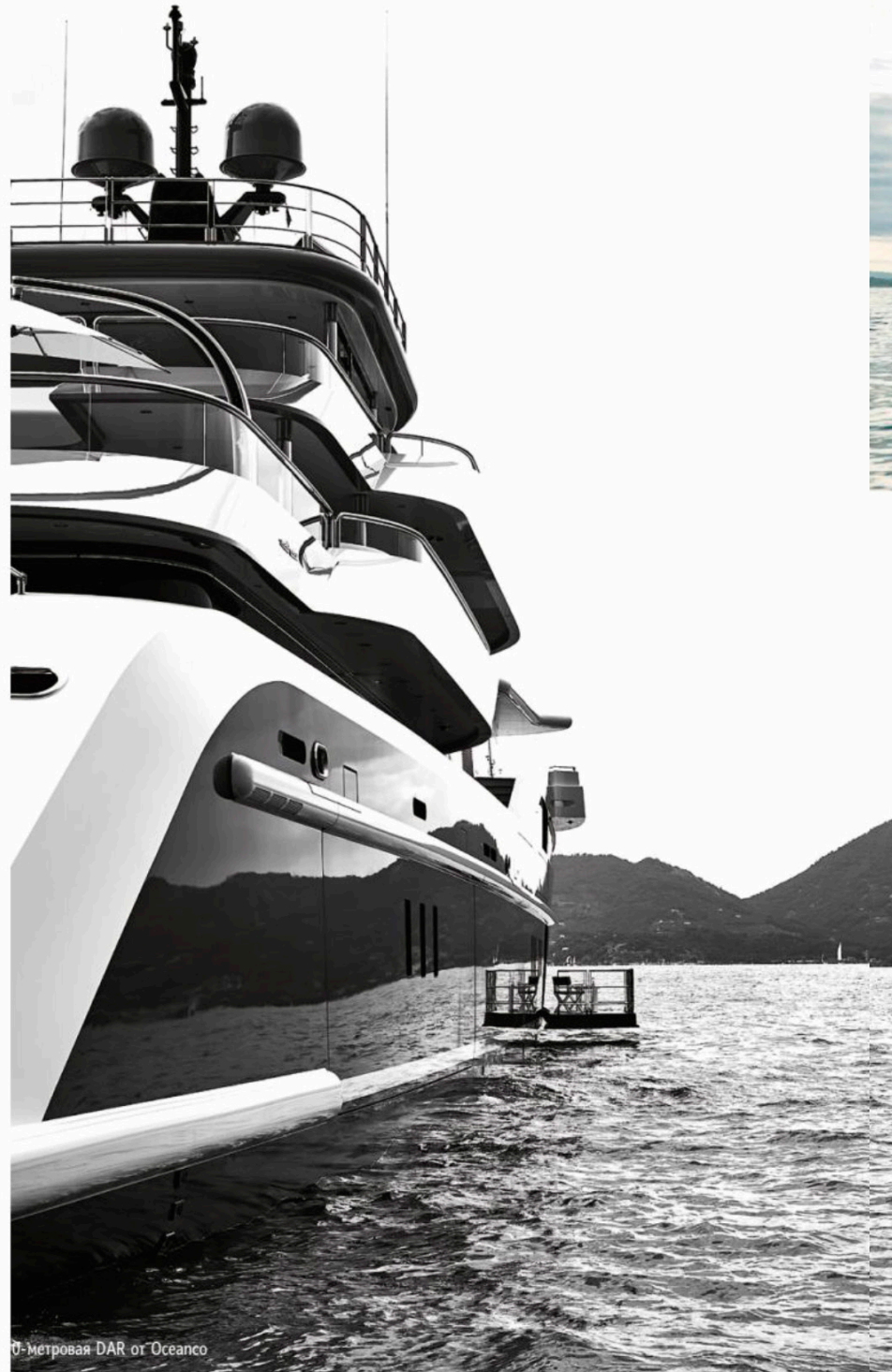
90-метровая DAR от Oceanco

Ключевым примером яхт, обладающих показателями мастерства проектирования и строительства, является удостоенная двойной награды 90-метровая DAR (ранее Prince Shark) от