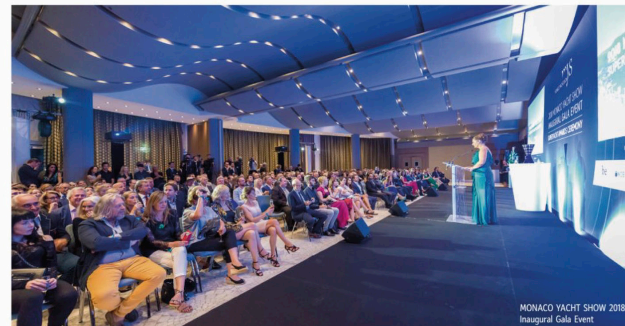
MONACO YACHT SHOW 2018. Inaugural Gala Event

покупке суперяхт, а также любых продуктов и услуг этой индустрии. В этом году состоялось 28-е Monaco Yacht Show с количеством посетителей на 2 % меньшим по сравнению с 2017 годом, – всё благодаря продуманным действиям Informa, которые сделали выбор в пользу качества, а не количества посетителей и привлекли новых, более молодых покупателей и желающих взять яхту в чартер. Занимая почти весь Порт Эркуль и демонстрируя разнообразный ассортимент экспонатов, MYS также стало более однородным: разделение территории на тематические зоны сделало более плавным движение вокруг причалов и