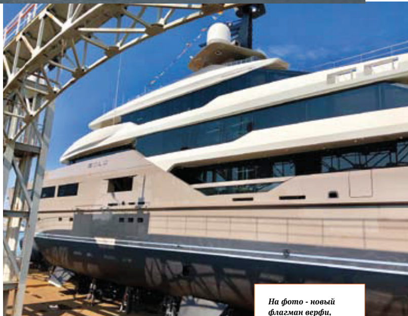
На фото - новый флагман верфи, 72-метровая суперяхта Solo

Философия Tankoa – меньше проектов, лучше качество. Это в прямом смысле слова верфь бутик, которая возводит одну-две яхты одновременно и концентрируется на сложной длине 50-90 м. В Италии, до недавнего времени, в этом сегменте присутствовали лишь Benetti и CRN, входящие в огромные конгломераты Azimut-Benetti и Ferretti Group. А Tankoa – фактически семейный бизнес, возложенный на плечи нескольких десятков профессионалов. Но даже это компания пово-